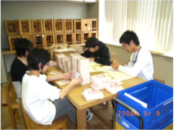
「ドリームフェスティバル 2008」フライヤーを神戸市内の学校へ送るため、仕分け中!

興味のある事業などがあれば、 こうべユースネット事務局まで お気軽にお電話下さい。